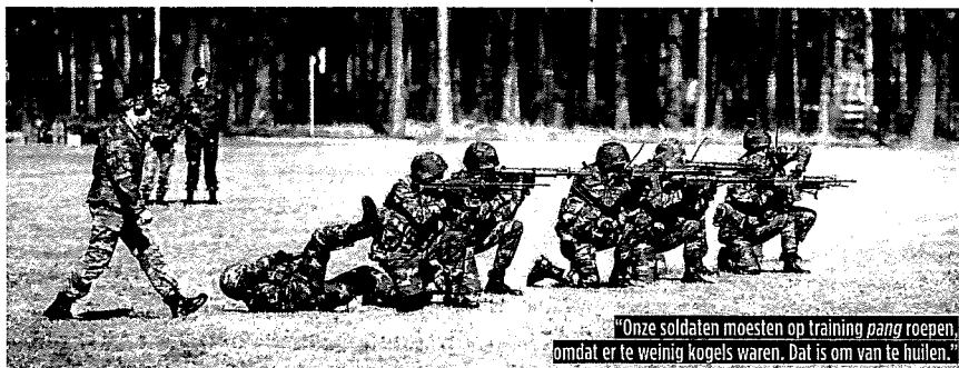
"Onze soldaten moesten op training pang roepen, omdat er te weinig kogels waren. Dat is om van te huilen."

gaan we ons internationaal belachelijk maken. We zullen slecht getrainde militairen naar conflictgebieden moeten sturen en er zullen doden vallen."