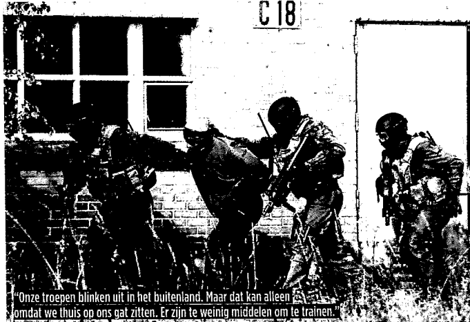
"Onze troepen blinken uit in het buitenland. Maar dat kan alleen omdat we thuis op ons gat zitten. Er zijn te weinig middelen om te trainen."

Ook een leidinggevende binnen het leger doet zijn verhaal. "Vorig jaar verscheen in de pers dat elke soldaat op training nog maar zeven kogels kreeg. Tijdens oefeningen moesten ze maar pang roepen. Dan sta je echt met je broek op de enkels. Het leger als schandpaal, ik word daar ziek van. Met dank ook aan F.C. De Kampioenen , dat de Belgische soldaten al meer dan twintig jaar te kijk zet door Xavier Waterslaeghers op te voeren. De meeste militairen zijn geen lamme papzakken. Ze staan te springen om op buitenlandse missies te gaan en willen zich nuttig maken. Wij blinken uit op veel terreinen: onze marine levert topwerk in de bestrijding van piraterij, onze ontminners behoren tot de internationale top, onze F-16-piloten staan hoog aangeschreven en onze special forces zijn internationaal heel populair, omdat ze uitstekend kunnen tolken en uitblinken in planning. Daar lees je nooit wat over in de pers. Wij doen veel met weinig middelen, maar we zitten op ons tandvlees. Het is vijf óver twaalf. Tot nu toe kunnen we nog goed getrainde en perfect uitgeruste soldaten naar het buitenland sturen, maar dat kan alleen omdat we thuis op ons gat zitten. Er is te weinig geld en materiaal om te trainen en als het zo doorgaat, ▶