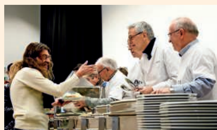
Le vice-Premier ministre Kris Peeters et l'ancien ministre-président flamand Luc Van den Brande ont servi vendredi à Malines des repas pour les défavorisés.