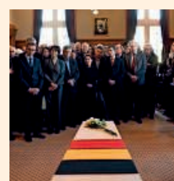
Des centaines de personnes se sont recueillies, vendredi, à Edegem devant la dépouille de l'ancien Premier ministre Leo Tindemans.