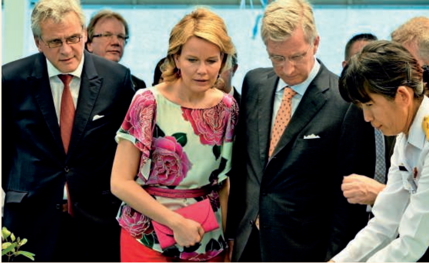
Les missions princières, comme celle au Vietnam en 2012, ont régulièrement suscité des frictions avec les Régions.

Alors que la Belgique perd des parts de marché dans le monde, la diplomatie économique gagnerait à une meilleure collaboration entre le Fédéral et les Régions.