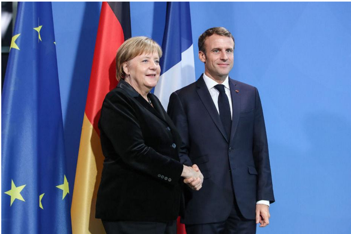
Duits Bondskanselier Angela Merkel en Frans president Emmanuel Macron.

Dinsdag ondertekenen Angela Merkel en Emmanuel Macron een nieuw verdrag dat de bilaterale banden tussen beide landen moet bekrachtigen. Wordt een versterkte Frans-Duitse as opnieuw dé ruggengraat van de Europese Unie?